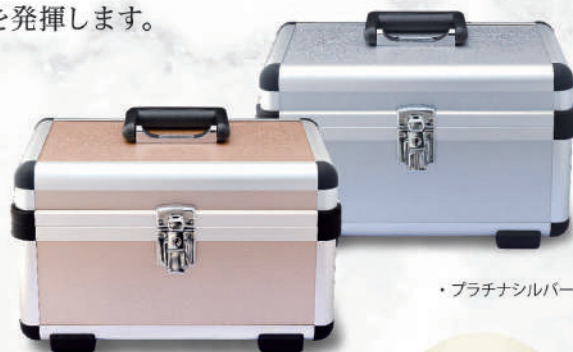
・プラチナシルバー